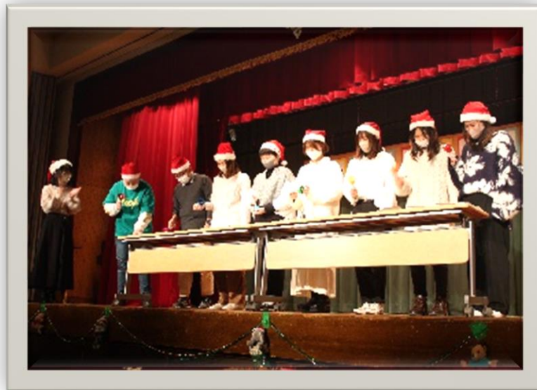
令和5年度クリスマス会の様子

お問い合わせ先 社会福祉法人松葉の園 児童養護施設まつば園 電話 03-3962-6869